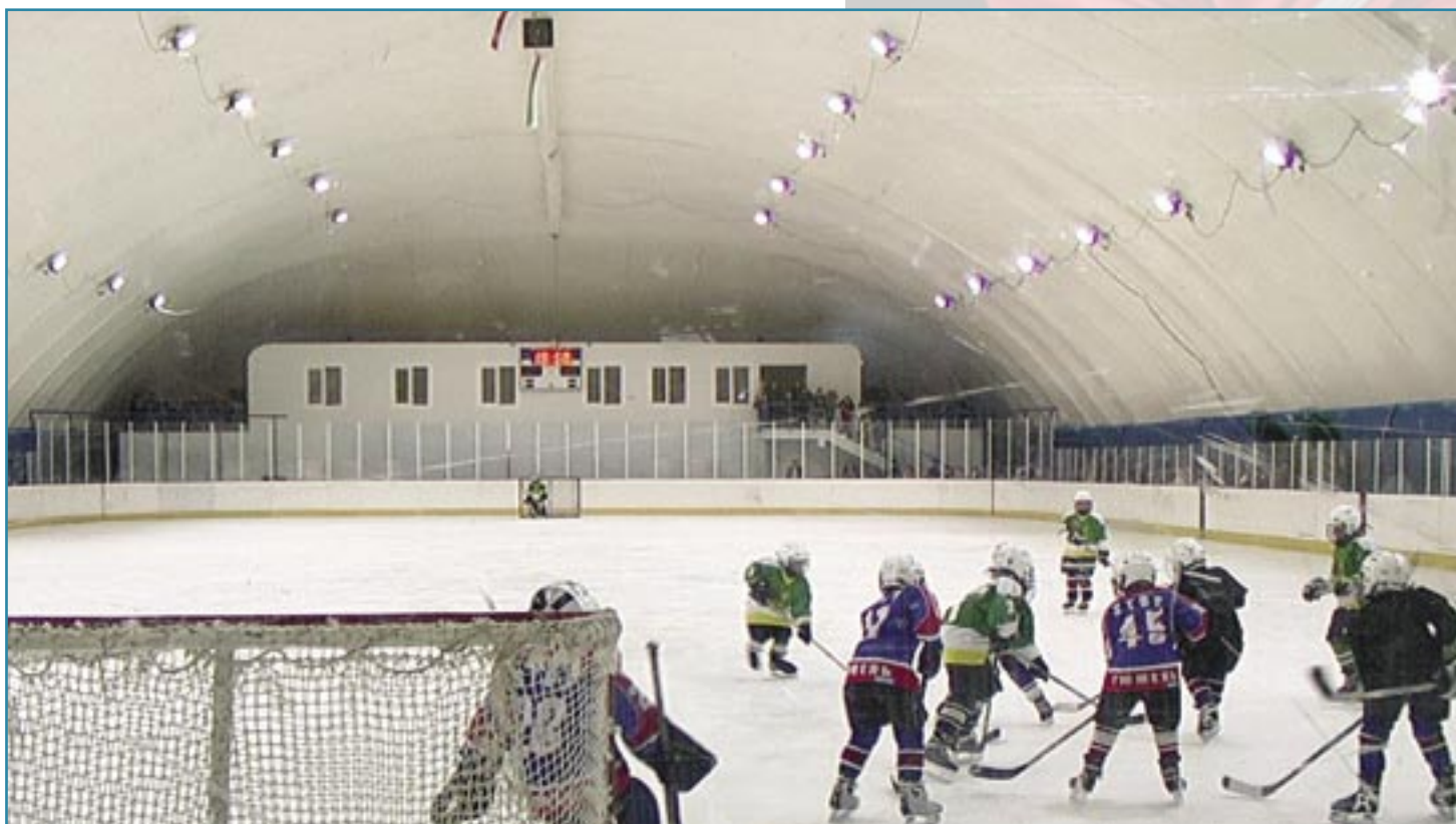
Duol Airdome Ishockeyhall.

Mer information och godkännanden finns i huvudbroschyren.